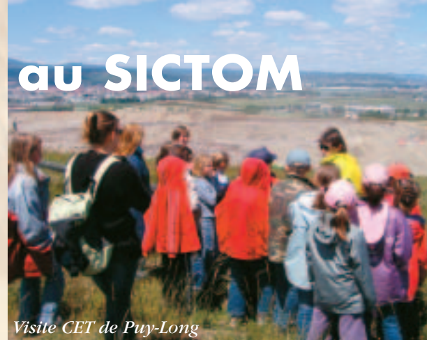
Visite CET de Puy-Long

Les élèves qui ont visité le centre d'enfouissement de Puy-Long à Clermont-Ferrand ont pu se rendre compte de l'énorme quantité de déchets produite par les habitants de l'agglomération clermontoise. Ils ont ainsi pu mesurer l'intérêt de valoriser au maximum les matériaux qui peuvent l'être afin de ne pas saturer ces sites.