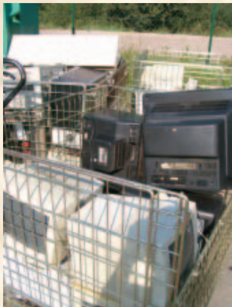
Collecte des DEEE

Depuis le mois d'août, les Déchets d'Équipements Électriques et Électroniques (DEEE) ainsi que les Déchets d'Activité de Soins à Risques Infectieux (DASRI) sont collectés en déchèterie et éliminés de manière spécifique.