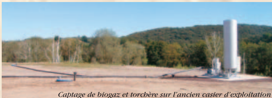
Captage de biogaz et torchère sur l'ancien casier d'exploitation

Engagés en 2006, les travaux au Centre d'Enfouissement Technique (CET) de Saint-Eloy-les-Mines permettent un traitement plus performant des déchets ultimes sur le territoire du SICTOM des Combrailles.