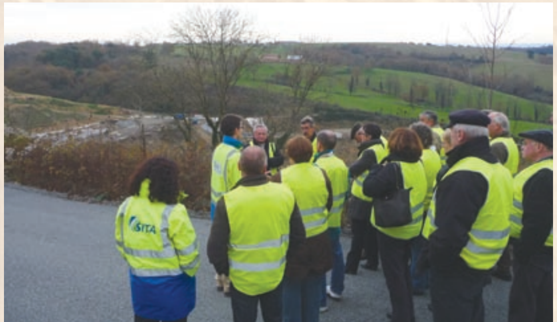
Visite des élus à l'ISDND de Cusset

Ce changement n'a pas été sans conséquences pour le SICTOM : le vidage direct des bennes de collecte d'ordures ménagères à Saint-Eloy-les-Mines n'étant plus possible, ces dernières pouvaient être amenées à parcourir de nombreux kilomètres supplémentaires pour que les déchets soient traités sur d'autres sites.